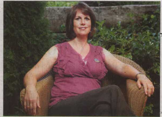
La escritora Elizabeth Kostova, en Madrid, tras la entrevista.

Para Kostova «cada cuadro, es una ventana abierta al mundo y el artista, cada creador, tiene la capacidad de entrar a formar parte activa de la vida diaria de mucha gente, de co-